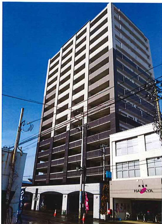
格調高い外観、間取りは使いやすい2LDK